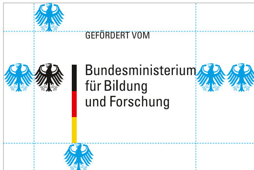
Konstruktion des Förderlogos

Alle Publikationen, bei denen das BMBF nicht Herausgeber ist, sind Fremdpublikationen. Fremdpublikationen erscheinen nicht im CD des BMBF.