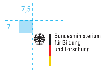
DIN A5 und DIN lang (105 x 210 mm): Bildwortmarke in 90%, Vermaßung in mm