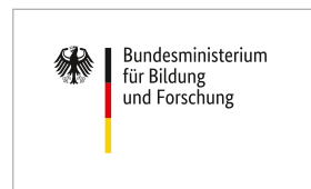
Farbe („Spot“, „CMYK“, „Plot“)

Die Bild-Wort-Marke steht immer linksbündig auf dem Identitätsbereich. Der Identitätsbereich stärkt die visuelle Präsenz der Bild-Wort-Marke. Er besteht aus einer weißen Fläche, die als Hintergrund für die Bild-Wort-Marke dient.