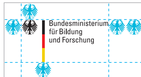
Die Schutzzone definiert den Weißraum um die Bildwortmarke (jeweils Größe des Adlers).