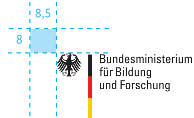
DIN A4: Bildwortmarke in 100%, Vermaßung in mm

Bei Veröffentlichungen zu ESF-kofinanzierten Programmen und Projekten ist zusätzlich zur Bildwortmarke des BMBF das EU-/ESF-Logo aufzuführen.